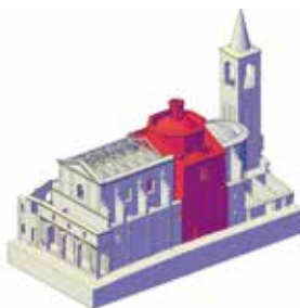
I lavori consolidano le coperture della chiesa, il campanile e il suo cono sommitale.

di tutela del patrimonio storico cittadino, che oltre al consolidamento del campanile di San Francesco prevede anche il restauro del tetto della chiesa per un ammontare di lavori pari a 455 mila euro.