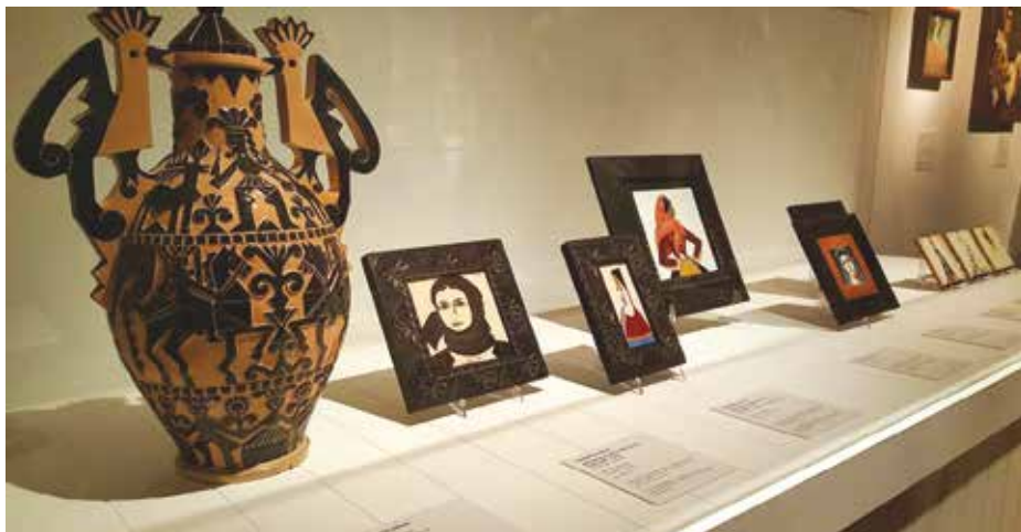
L'anfora sardesca di Federico Melis del Museo Civico di Urbania, in mostra a Palazzo Ferragamo di Firenze.

La Fondazione Cassa di Risparmio di Pesaro è lo sponsor di Primaverarte e permette -oramai da molti anni- con il suo sostegno la realizzazione delle mostre che valorizzano le collezioni artistiche del palazzo ducale e la visita del complesso monumentale.