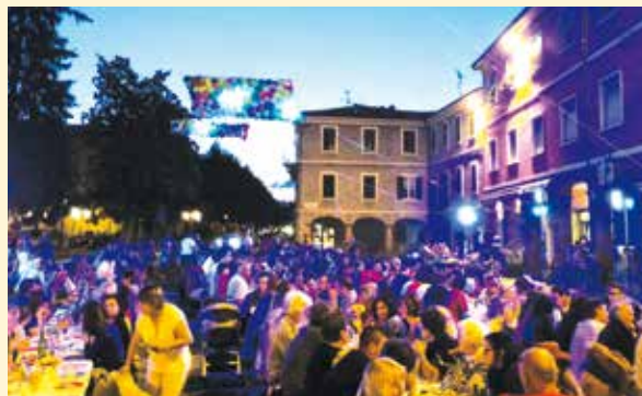
I giovedì dell'estate durante l'organizzazione del Gruppo Esercenti "Urbania da Gusto". Prima serata con la tradizionale cena in piazza.