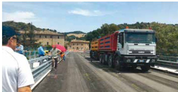
Fasi del collaudo statico di luglio 2017 prima della riapertura.