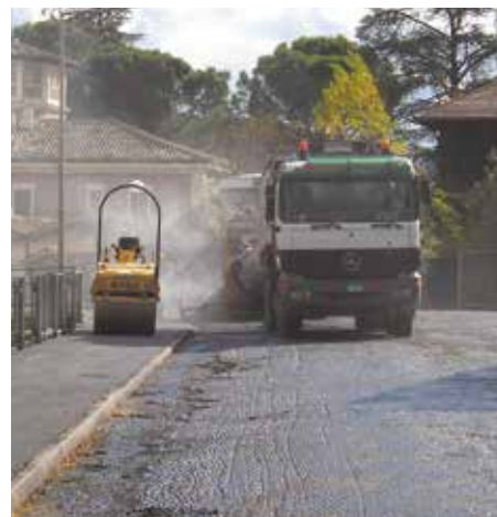
Asfaltatura in piazza Pellipario