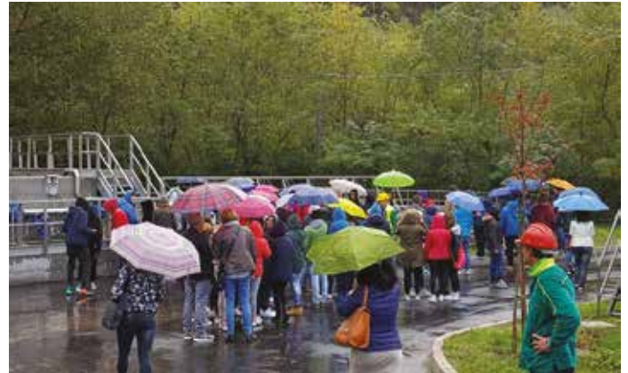
Cerimonia di inaugurazione del nuovo depuratore con i ragazzi delle scuole.

hanno riguardato la ristrutturazione completa e l'ampliamento dell'esistente, l'implementazione di un nuovo processo che consente di rimuovere con un minore impatto per l'ambiente gli inquinanti derivati dal carbonio, dall'azoto e dal fosforo e l'installazione di un impianto di disinfezione finale mediante raggi U.V., più moderna ed efficace rispetto all'attuale sistema di clorazione. Attraverso il nuovo controllore di processo a cicli pulsanti, che può essere definito il cuore dell'impianto, è possibile rimuovere gli inquinanti derivati