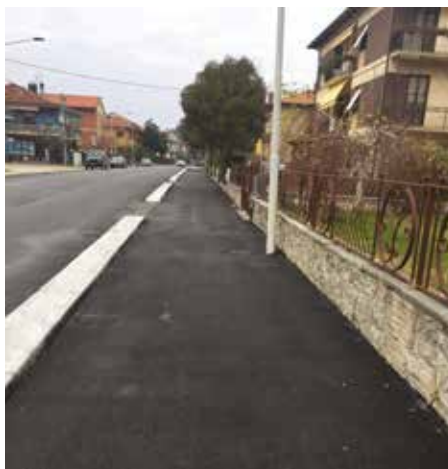
Pista ciclopedonale di via Molino dei Signori

Iniziato nel 2015 il Piano di manutenzione delle strade cittadine non più evento straordinario, ma progettazione programmata e concertata con i Consigli di quartiere. Finora ha realizzato l'obiettivo di asfaltare 18 strade. L'impegno della Giunta è la sistemazione entro pochi anni di tutte le strade più deteriorate. Il 2016 ha visto realizzare l'asfaltatura delle seguenti vie: via Metauro, piazza Pellipario, via Manzoni, via Liburdi, via Cattaneo, via Don Gnocchi, via della Casina, via Molino dei Signori. In quest'ultima via si è anche realizzato il primo stralcio di pista ciclopedonale che nasce con l'intento di collegare tale viabilità della nuova lottizzazione della Palazzina alla rete esistente del centro abitato.