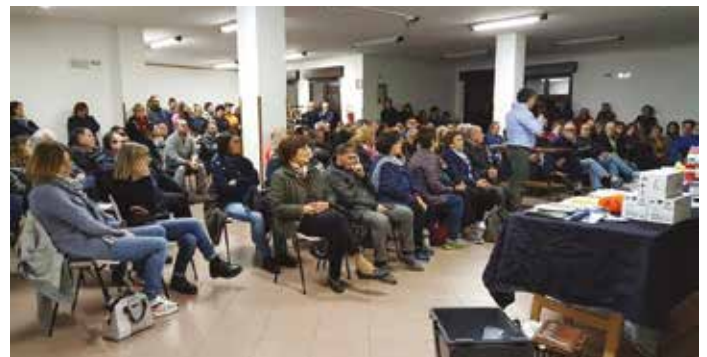
Uno dei 4 incontri presso il salone dell'Oratorio parrocchiale

Ci potranno essere disagi e disagi iniziali che chiediamo di segnalare al Numero verde di Marche Multiservizi 800 600 999 (da lun. a sab. 8.30-13.00 - mart. e giov. 14.30-16.30) oppure al Comune di Urbania all'indirizzo di posta elettronica: ambiente@comune.urbania.ps.it - tel. 0722.313135.