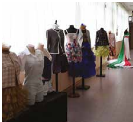
Modelli realizzati dagli Studenti dell'Istituto Professionale della Moda di Urbania

dei recenti eventi sismici l'avvio delle attività è stato posticipato al 18 gennaio 2017; presto saranno pubblicate le modalità di selezione dei partecipanti al corso.