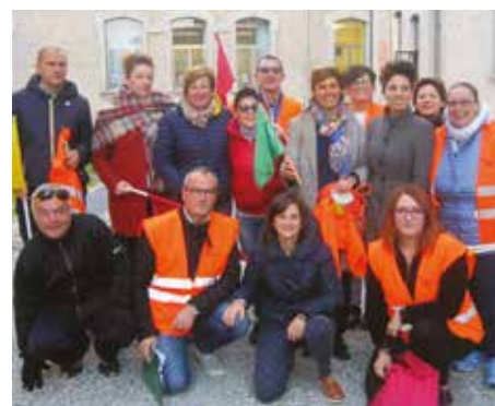
I genitori volontari che accompagnano i bambini a scuola

E' molto bello vedere i ragazzi raggiungere la scuola elementare a piedi in gruppo grazie alla simpatica e divertente iniziativa "Piedibus", organizzata dall'Assessorato alla scuola e servizi sociali del Comune. L'iniziativa è rivolta ai bambini della Scuola Primaria e consiste nel recarsi a scuola e ritornare a casa a piedi invece che con i mezzi di trasporto. Diversi i genitori che hanno dato la loro disponibilità per accompagnare i ragazzi, muniti di paletta e gilet. L'iniziativa ha riscontrato molto successo e in molti hanno accolto con soddisfazione l'invito a far vivere ai loro figli questa bella e formativa esperienza. La finalità consiste nel responsabilizzare i bambini a percorrere un tratto di strada a piedi per la loro autonomia, per il beneficio fisico e per fare un dono gradito all'ambiente. Il progetto si realizza nella sola giornata del sabato in 4 punti di incontro per la partenza ed il rientro (via Mazzini, via XXIII gennaio, via Piazzale del Fornacione e via Roma).