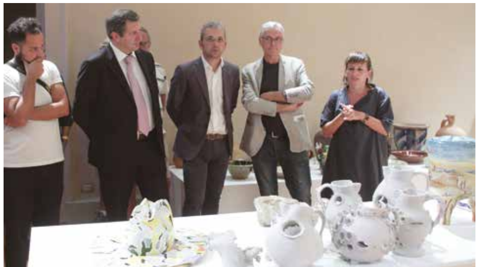
Inaugurazione a Faenza del padiglione dedicato alla ceramica di Urbania (Mostra "Fittile Futuribile")