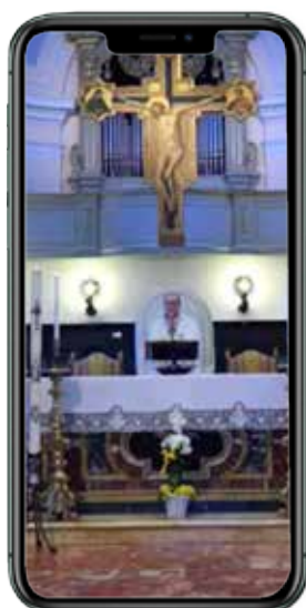
La S. Messa in Cattedrale