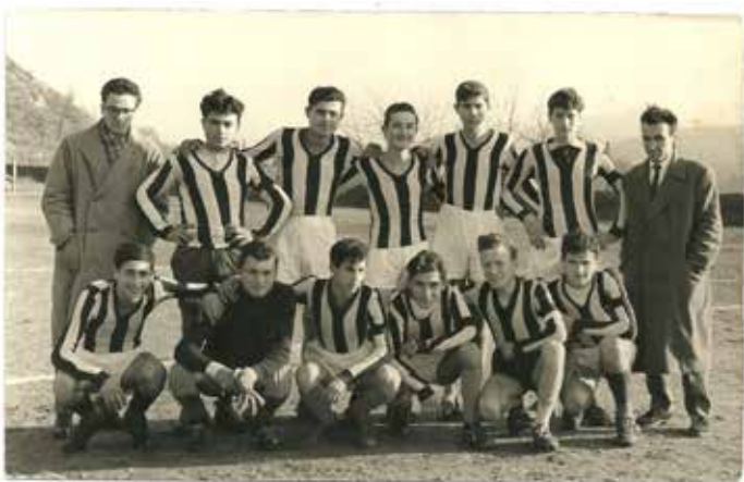
Torneo giovanile estivo del 1954, nel vecchio campo da calcio.