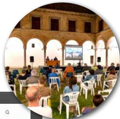
Presentazione del portale "Visit Urbania" nel Cortile del Palazzo Ducale, 13 luglio 2020

È online il nuovo portale turistico/culturale di Urbania www.visiturbania.com