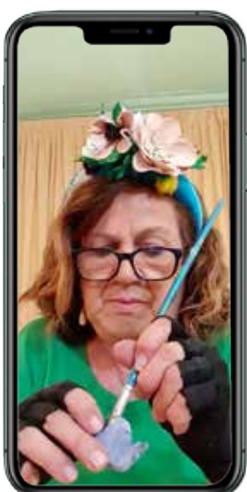
Nonna Glò per i più piccoli

Durante il periodo dell'emergenza Covid abbiamo lanciato una particolare raccolta fondi per le famiglie urbaniesi in difficoltà, con lo slogan "Uniamo i nostri cuori". L'iniziativa, organizzata dall'Amministrazione Comunale è volta a sostenere le famiglie di Urbania che sono in forte difficoltà a causa dell'emergenza Coronavirus. È possibile partecipare con una donazione sul conto corrente IT20Z0311168690000000003811.