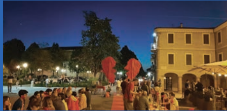
Cena in piazza: Urbania che passione!