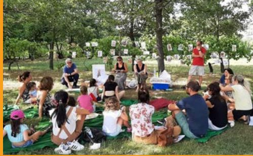
Libri a merenda