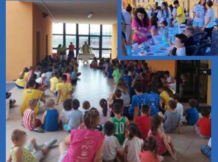
Oratorio centro estivo e laboratori in piazza