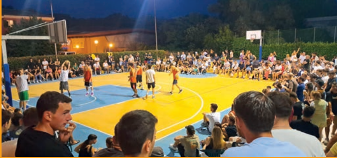
Torneo Basket 3 contro 3