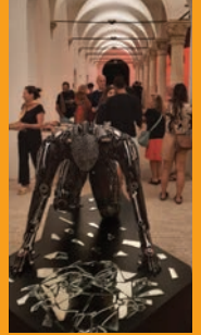
EXPO Galleria 12