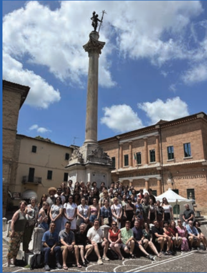
Festival of International Opera - Centro Studi Italiani