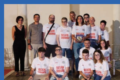
Baskin Tartarughe di Urbania e Vichinghi di Fermignano