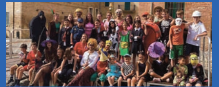
Carnival Day centro estivo Nuoto Montefeltro