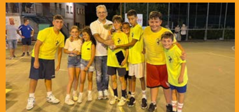
3° Torneo "Amici di Lisa"