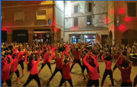
I Giovedì di Urbania