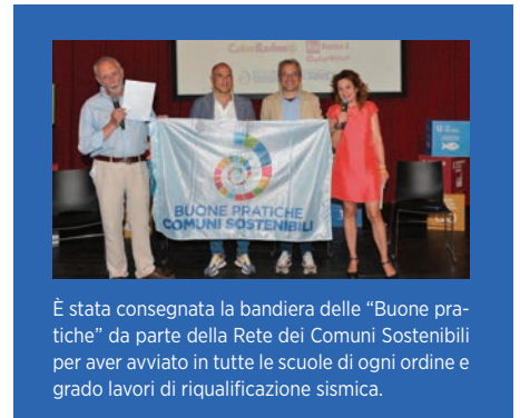
È stata consegnata la bandiera delle "Buone pratiche" da parte della Rete dei Comuni Sostenibili per aver avviato in tutte le scuole di ogni ordine e grado lavori di riqualificazione sismica.

Il progetto "Laboratori Green Sostenibili" prevede l'installazione di una serra e l'acquisto di strumentazioni per la trasformazione di materie prime.