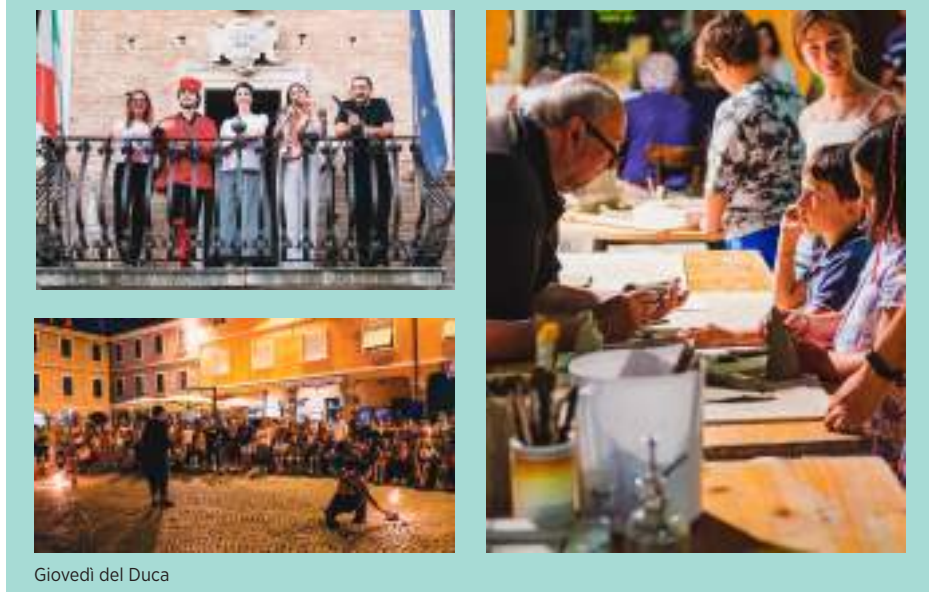
Giovedì del Duca