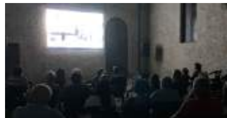
Sotto Le Stelle - Cinema all'aperto