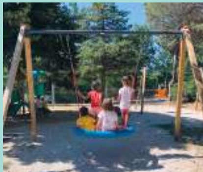
Nuovo parco giochi alla scuola materna Pio XII della frazione di Muraglione.