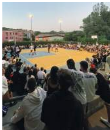
Torneo Street Basket 3x3