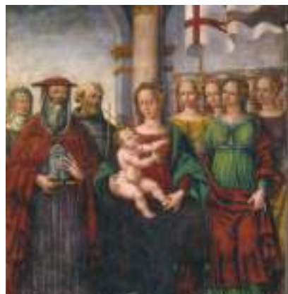
Affresco raffigurante la Vergine con il bambino, Sant'Orsola e il Cardinal Bessarione, attribuito a Timoteo Viti, sec. XV, chiesa di S. Chiara, Urbania.

I giardini pubblici non sono solo uno spazio rinnovato, ma un vero e proprio servizio ai cittadini; per molti è l'unico spazio bello e gradevole da vivere durante l'estate.