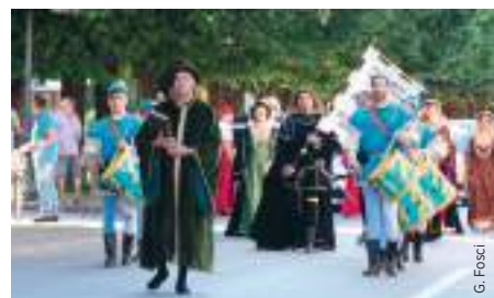
Il Cardinale Bessarione e il Duca Federico - corteo storico