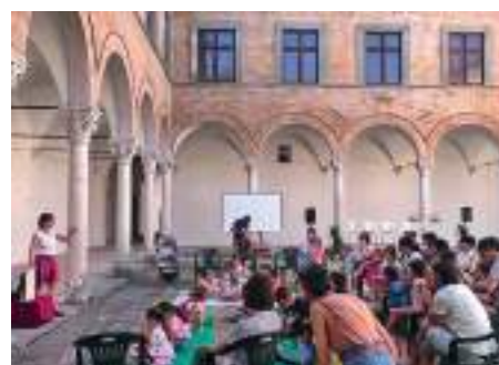
Libri a merenda