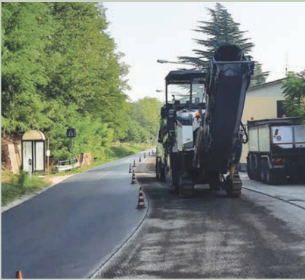
SS. Metaurensis Muraglione