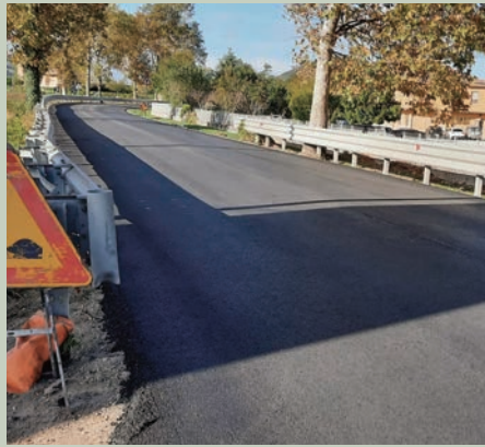
SS. 73 bis Santa Maria del Piano