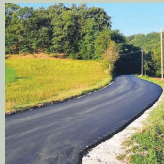
Strada San Giorgio