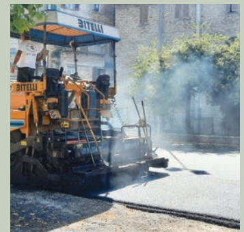
Piazza del Mercato