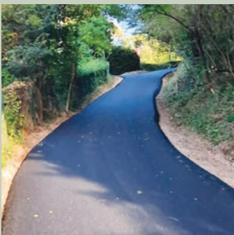
Via della Porcellana