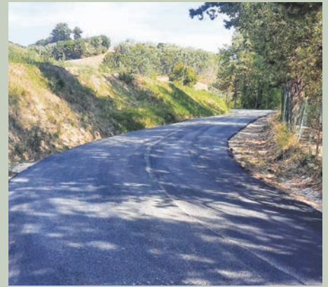
Strada Monte San Pietro