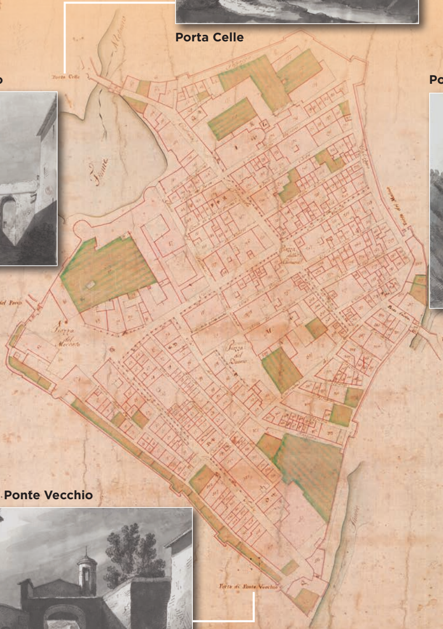
Porta di Ponte Vecchio