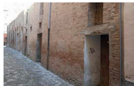
Parte del Palazzo Comunale oggetto di intervento

A seguito delle risorse assegnate dal Ministero dell'Interno, è iniziato un primo intervento di ristrutturazione e messa in sicurezza del Palazzo Comunale pari a € 170.000 attraverso lavori di risanamento e consolidamento di solai e ridistribuzione di spazi non utilizzabili. I lavori iniziati riguardano la parte sud-est del palazzo, l'area che più necessita di intervento e che permetterà il recupero funzionale di locali sia al piano terra che al primo piano.