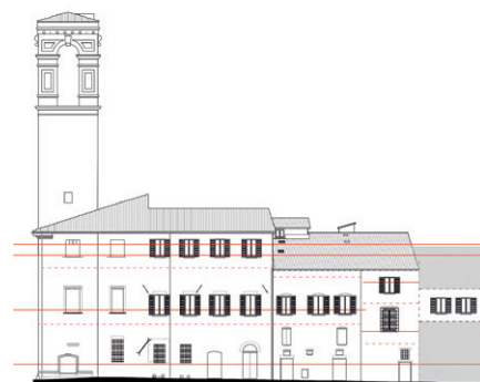
Prospetto su via C. Piccolpasso del progetto generale del Palazzo Comunale

Il progetto ha lo scopo di superare le carenze esistenti permettendo il recupero di ambienti inutilizzabili per la ridotta altezza interna dovuta alle ristrutturazioni del dopoguerra.