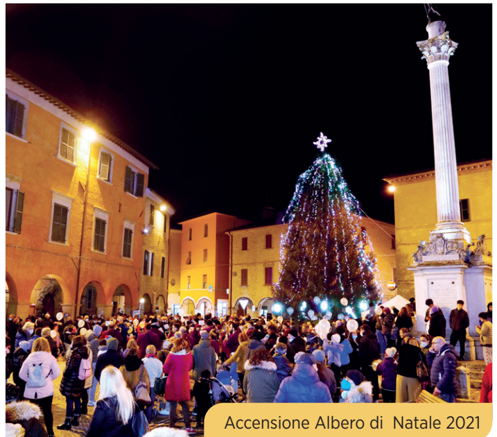
Accensione Albero di Natale 2021