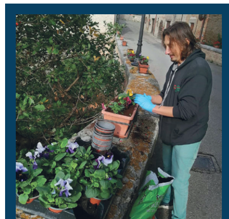
Decoro urbano, posizionamento di piante floreali nei ponti del centro storico.