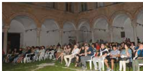
Il pubblico presente al saggio del GBU di fine anno che si è svolto nel cortile del Palazzo Ducale.