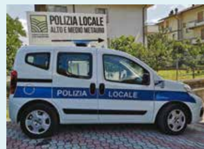
Il nuovo mezzo in dotazione alla Polizia Locale, recentemente acquistato.